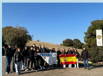
Ξεναγηση και περιήγηση στην Βεργίνα και την Έδεσσα