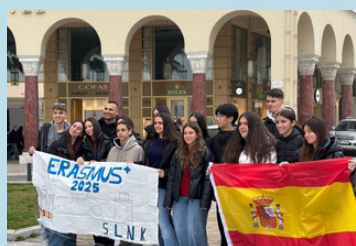
Περιήγηση στην πόλη

Τα παιδιά και οι συνάδελφοι από το ισπανικό σχολείο είχαν την ευκαιρία να γνωρίσουν την πόλη μας και την πόλη της Θεσσαλονίκης, την πλούσια Ιστορία της και τα μοναδικά αξιοθέατά της. Τους δόθηκε η ευκαιρία να εργαστούν μαζί σε κοινό project σχετικά με τη 3D μοντελοποίηση και εκτύπωση αντικειμένων, να συμμετάσχουν σε μαθήματα στο Σχολείο μας αλλά και σε πολιτιστικές δράσεις εκτός Σχολείου και να γνωρίσουν το εκπαιδευτικό μας σύστημα.