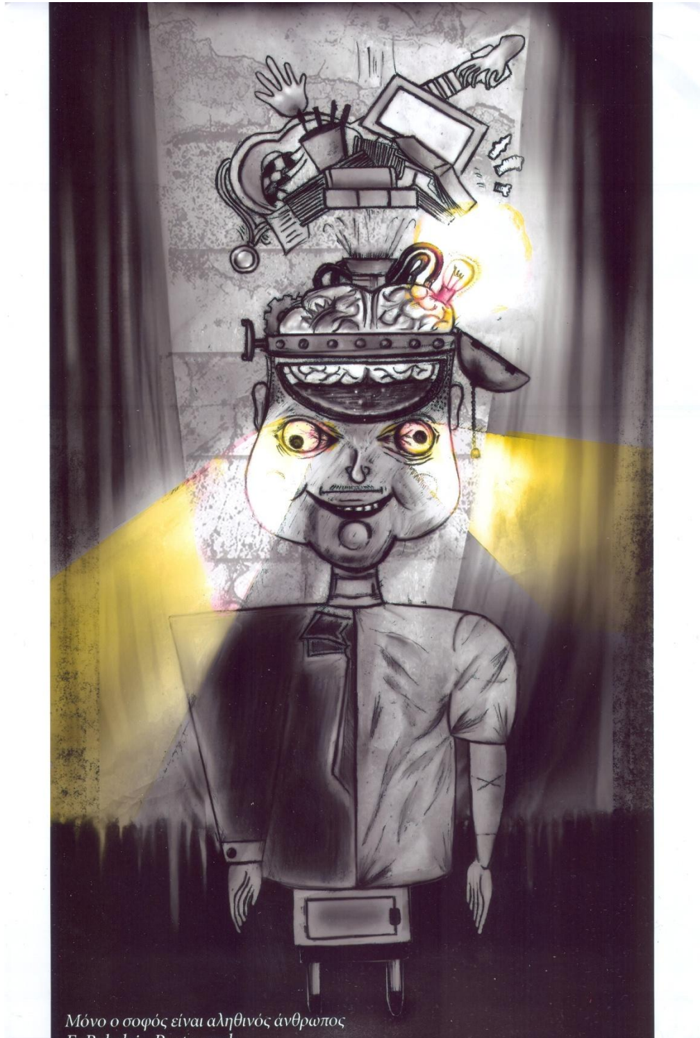
Σωτήρης Παυλίδης, 2 ο ΓΕ.Λ. Αγίου Αθανασίου (Νέας Μεσημβρίας)