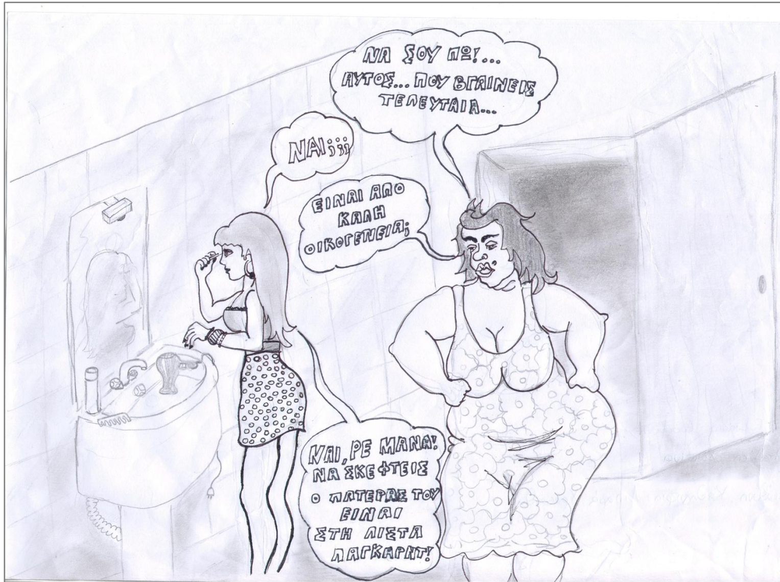
Χριστίνα Αλταλίκη, 5 ο Γυμνάσιο Ευόσμου